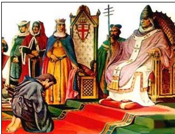
ARRIGO IV SI PROSTRA AI PIEDI DI GREGORIO VII A CANOSSA

I due grandi antagonisti del tempo furono l'imperatore tedesco Arrigo IV , salito al trono nel 1065, e il monaco Ildebrando di Soana, diventato papa col nome di Gregorio VII nel 1073. Fra i due avvenne una lotta senza quartiere, nel corso della quale Arrigo giunse a deporre il pontefice e Gregorio reagì scomunicando l'imperatore, cioè estromettendolo dalla comunità dei fedeli e di conseguenza sciogliendo dal giuramento di fedeltà i suoi sudditi. In questo contesto è da ricordare l'episodio del castello di Canossa (1077), quando la contessa Matilde riuscì a riconciliare momentaneamente Arrigo e Gregorio; successivamente però il conflitto riprese con tutto il suo vigore ed è ricordato con il nome di lotta per le investiture , dove la grossa questione era su chi doveva nominare i vescovi-conti.