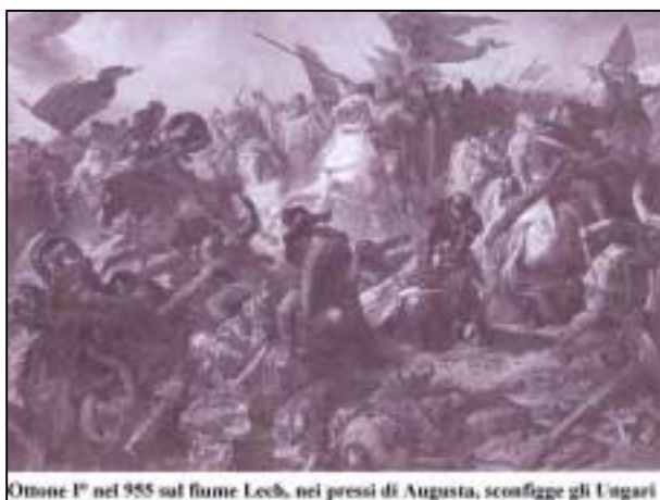
Ottone I° nel 955 sul fiume Lech, nei pressi di Augusta, sconfigge gli Ungari.

Però il capostipite dei Pallavicino vero e proprio fu un altro Adalberto , nato in Belgrado d'Ungheria, che era al seguito di Liutolfo, figlio di Ottone I il Grande nella sua spedizione in Italia contro il ribelle Berengario II (956) in qualità di comandante della cavalleria. Quando poi Ottone I fu incoronato Imperatore (962), nominò Adalberto suo Vicario e Luogotenente